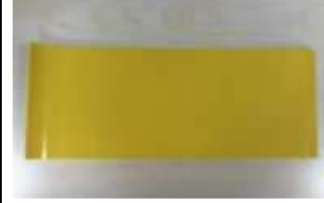
Numunenin Fotoğrafı / Sample Picture